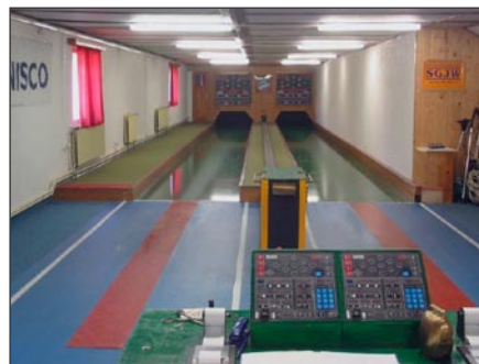
Nahoře smiřická dvoudráha a dole webová stránka oddílu