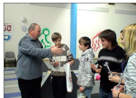
Předávání pohárů bylo příjemné