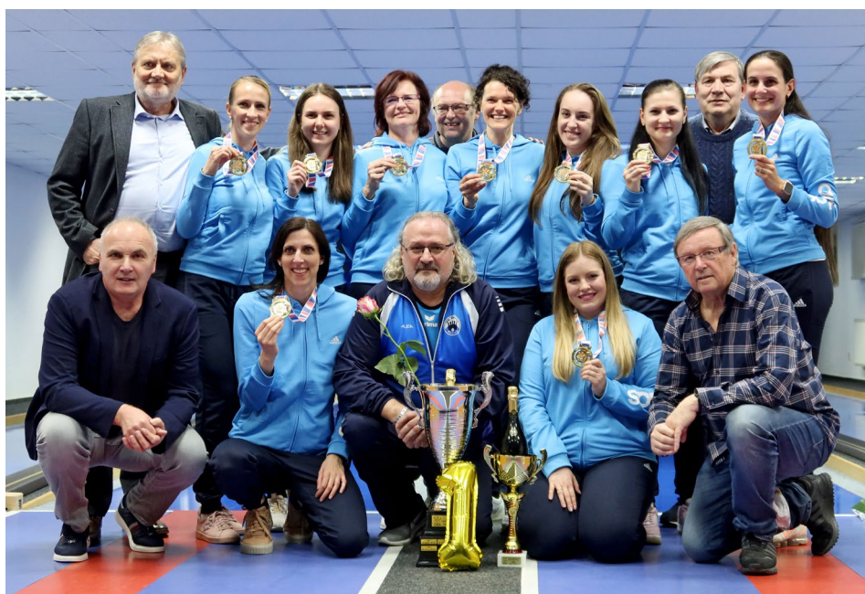
Družstvo žen KK Slovan Rosice získalo titul počtvrté v řadě

Majitelky bronzových medailí byly prvními otazníkem letošního ročníku. Konec soutěže byl sice plánován na sobotu 9. dubna, ale zápas KK Blansko – Slavia Praha se odehrál až ve čtvrtek 21. 4. od 18 hodin. Tento zápas definitivně rozhodl mimo jiné o konečném třetím místě letošního ročníku. Slavia nezaváhala a odvezla si do Prahy díky výhře 6:2 bronzové medaile.