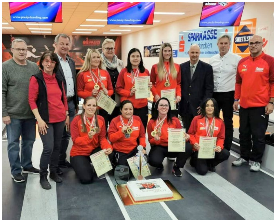
Ženské družstvo SK FWT-Composites Neunkirchen, vítěz rakouské Superligy