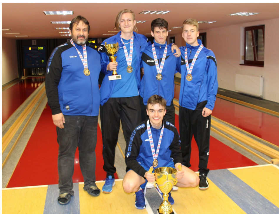
Dorostenecké družstvo KK Zábřeh s vítězným pohárem a medailemi