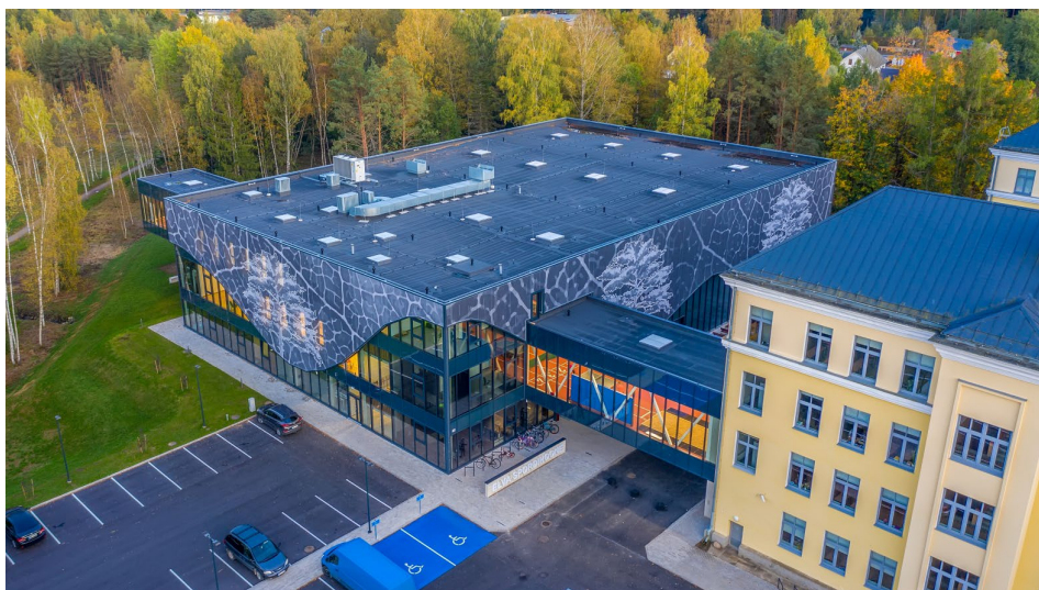
Dějiště mistrovství světa v estonské Elvě