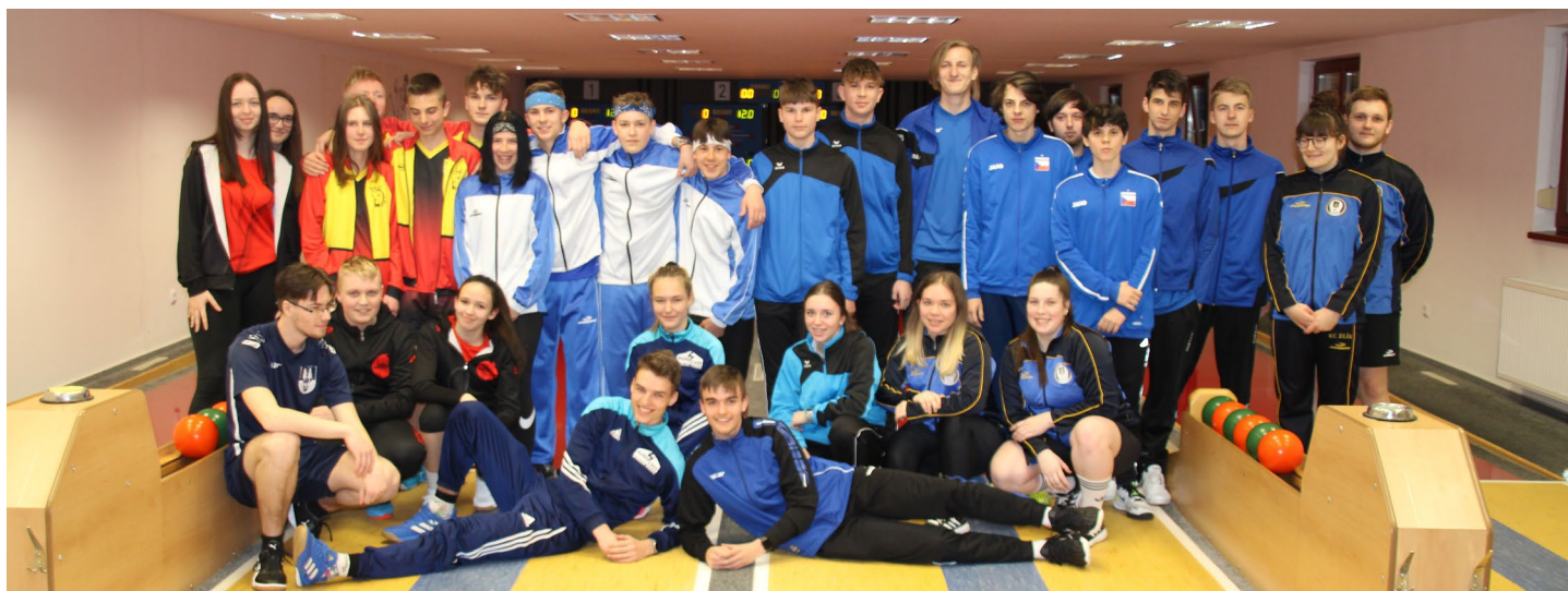
Společná fotografie účastníků finále kuželekářské ligy dorostu