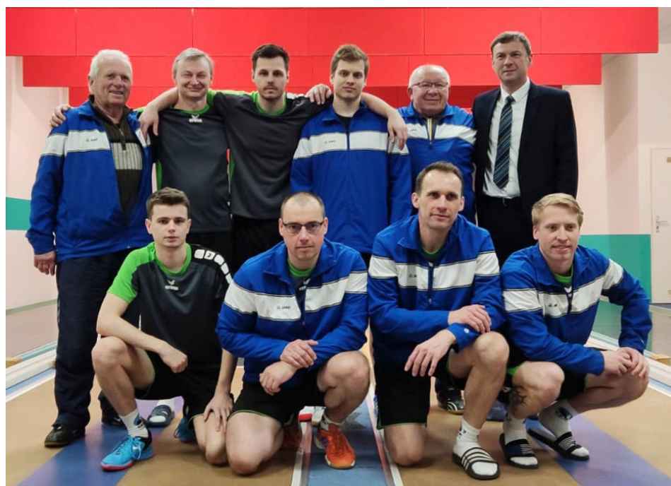
Hořické družstvo mužů zvítězilo v 1. KLM a zajistilo si tak přímý postup do Interligy