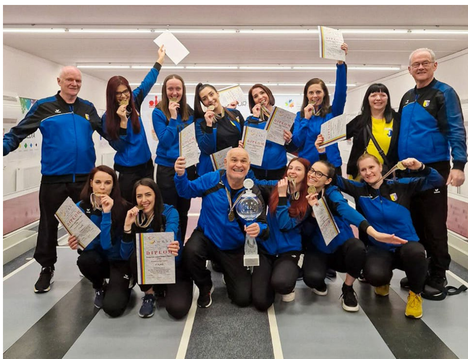
Vítězky Ligy mistrů – kuželkářky KK Mlaka Rijeka (CRO)