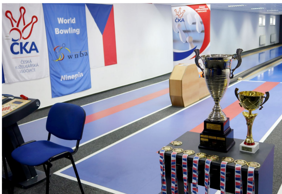
Příprava na slavnostní předávání medailí a pohárů