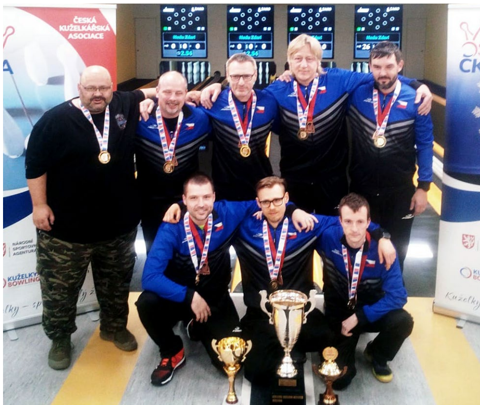
Družstvo mužů SKK Rokycany se z titulu mistra ČR raduje po pěti letech